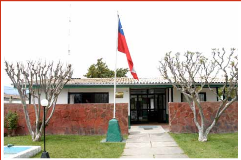
Carabineros de Chile - Tenencia Santa María