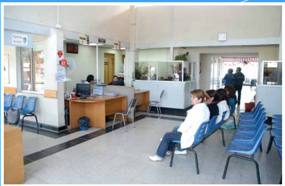
CESFAM Valle de los Libertadores - Avda. Alessandri N° 196