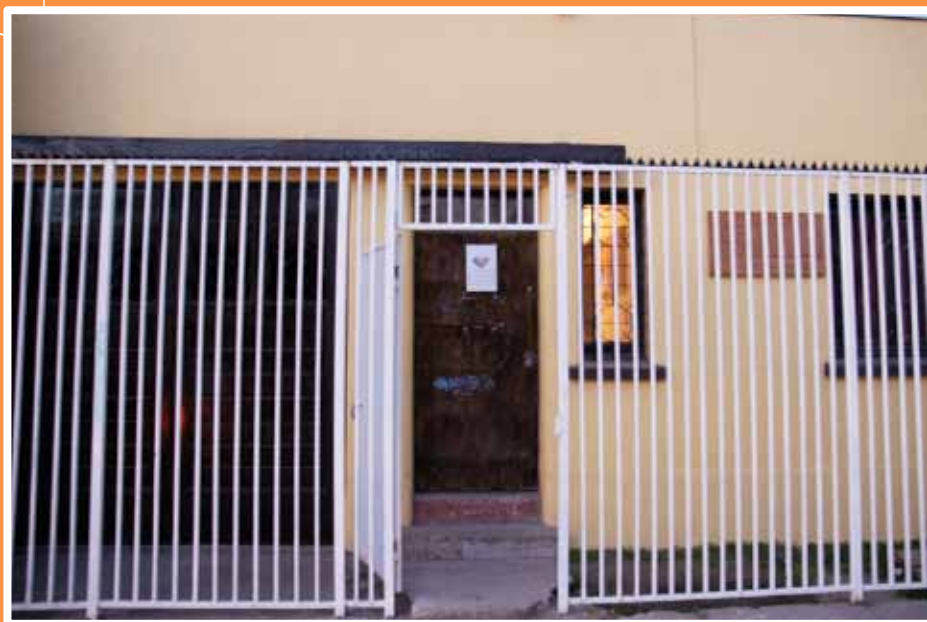
Programa: CONACE - PREVIENE Dirección: Antonio Varas N° 15 - Teléfono: 373238 Llay Llay