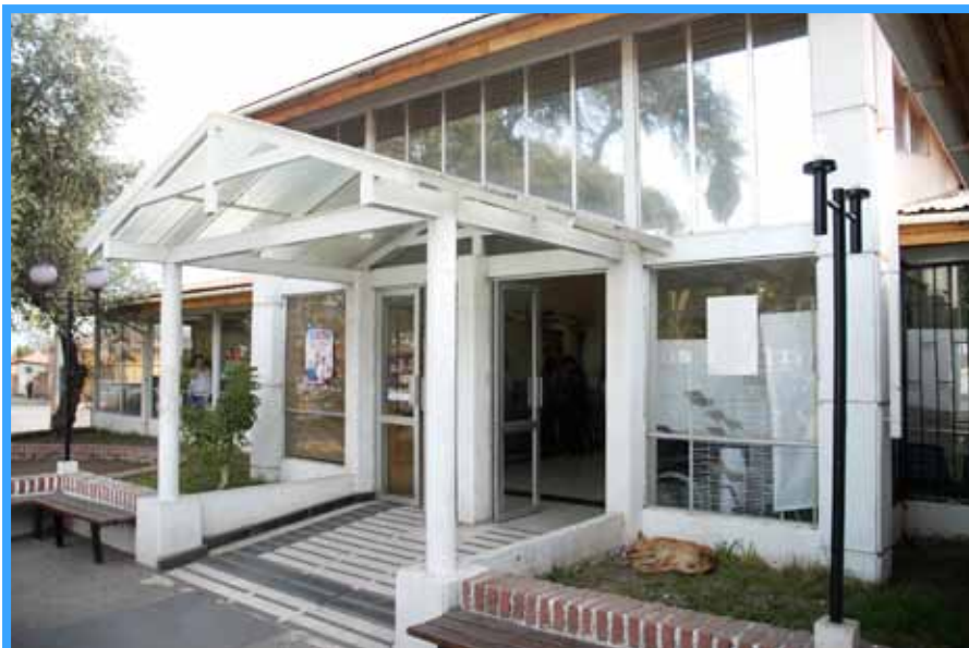
CESFAM Valle de los Libertadores - Avda. Alessandri N° 196