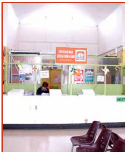
Centro de Salud Familiar CESFAM Irrazabal N° 246 Teléfono: 373243