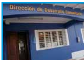
Dirección de Desarrollo Comunitario San Martín N° 733