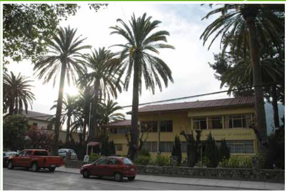
Ilustre Municipalidad de Panquehue Troncal N° 1166