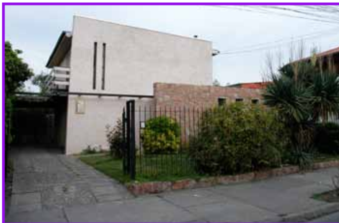
Oficina Defensa Laboral Traslaviña N° 172, San Felipe - Teléfono: 343902

Programa: Junta Nacional de Auxilio Escolar y Becas Provincia San Felipe Institución responsable: JUNAEB