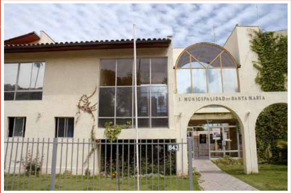
Ilustre Municipalidad de Santa María